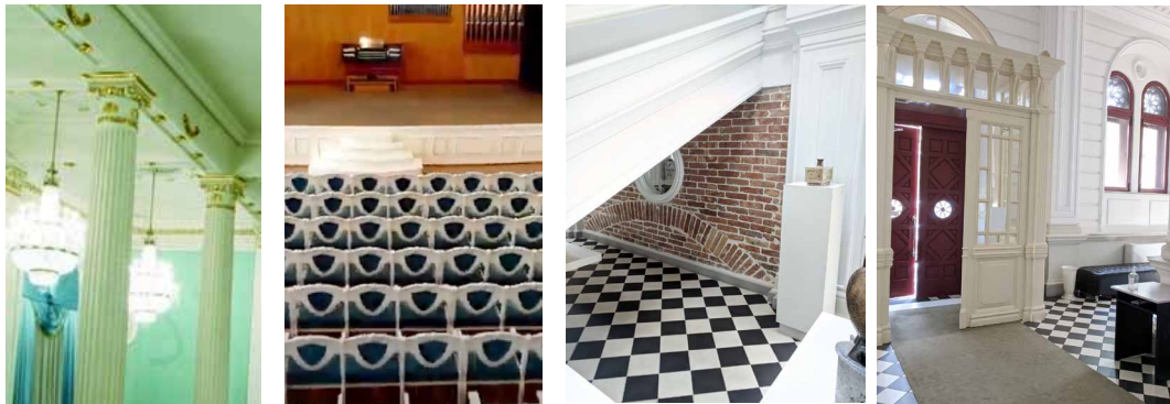
Fig. 1-2. Implementări stilistice în designul interior al Sălii cu Orgă din Chișinău, https://www.publika.md/sala-cu-orga-capata-viata-cum-va-arata-bijuteria-arhitecturala-a-capitalei_2992058.html