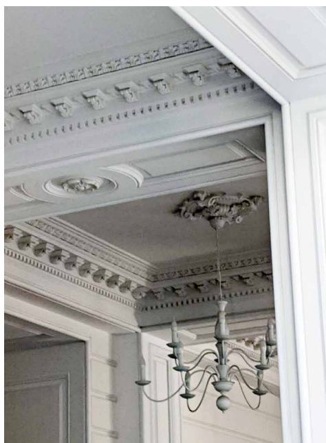
Fig. 8, 9, 10, 11, Soluții moderne în designul interior al MNAM (foto Liliana Platon)