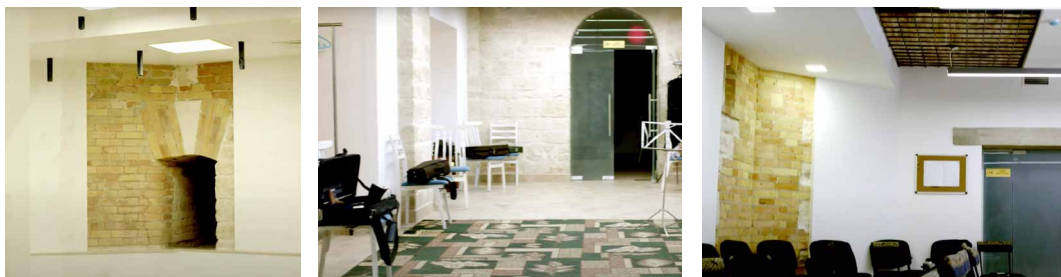
Fig. 5, 6, 7. Soluții moderne în designul interior al Sălii cu Orgă din Chișinău, https://www.youtube.com/watch?v=NdOkvdfb5f4 , https://www.ziarulnational.md/video-un-milion-de-la-bucuresti-pentru-renovarea-salii-cu-orga-din-chisinau-veche-de-mai-bine-de-un-secol-o-imagina-splendida-monumentul-a-capatat-o-eleganta-deosebita/

a aerului, de siguranță și securitate a încăperilor conform normativelor contemporane pentru astfel de edificii (Fig. 8, 9, 10, 11).