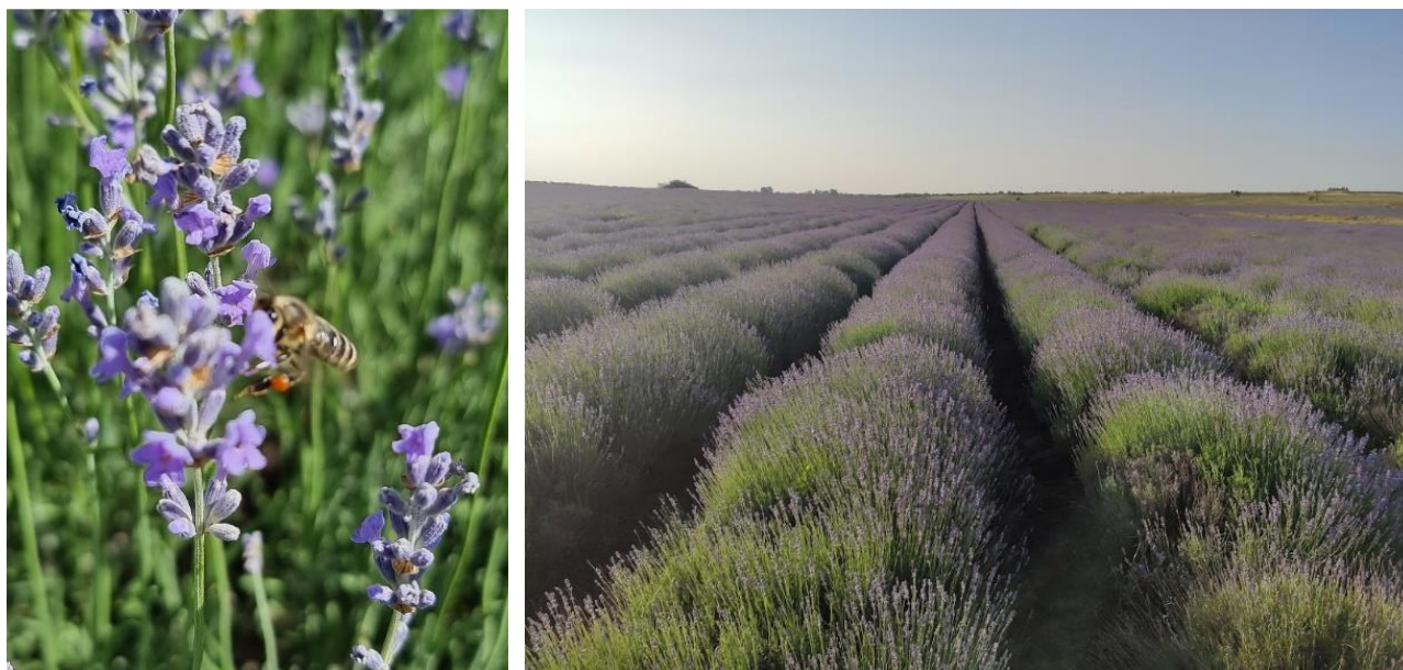
Figura 1. Aspectul plantației de leventică și colectarea nectarului de albina lucrătoare

Intensitatea de zbor a albinelor fost evaluată prin numărarea directă a albinelor care se întorceau din câmp la stup cu nectar sau cu gemotoace de polen pe picioarele posterioare, pe parcursul a 5 minute. Intensitatea zborului albinelor a fost determinată la începutul înfloririi leventicai (20.06.202, mijlocul (25.06.25) și la finele perioadei de înflorire (01.07.2025), în intervalul de timp de orele 10 00 până la 15 00 . Pentru aprecierea gradului de valorificare a plantației de leventică, s-a determinat numărul albinelor lucrătoare observate în câmp timp de 5-minute în raza de 1-2 m, la două distanțe de 100 m și 700 m față de stupină. 100 m,